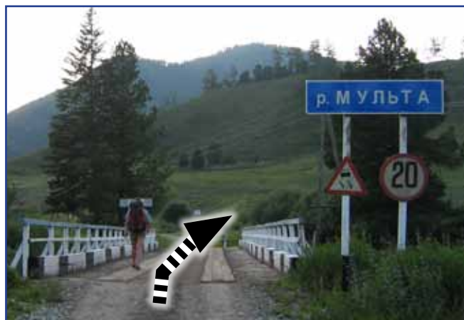
Схема проезда Усть-Кокса — Мульта — База «Вечный Странник»

От села Мульта в Маральник ведет единственная грунтовая дорога протяженностью 9 км. Если ехать по этой дороге, то ворота базы расположены справа сразу за мостом через реку Мульта.